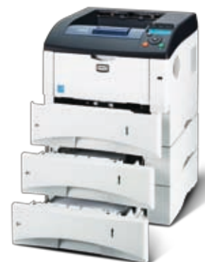
Abbildung enthält Optionen.

KYOCERA MITA DEUTSCHLAND GmbH – Otto-Hahn-Str.12 – D-40670 Meerbusch Infoline: 08 00 8 67 78 76 – Fax: +49 (0) 21 59 9 18 - 106 – www.kyoceramita.de